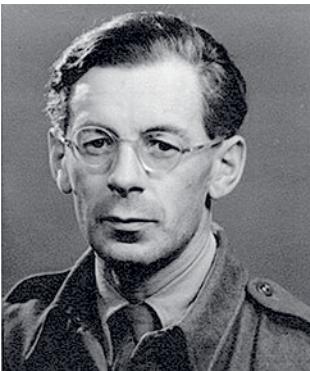
Peter de Mendelssohn, 1945