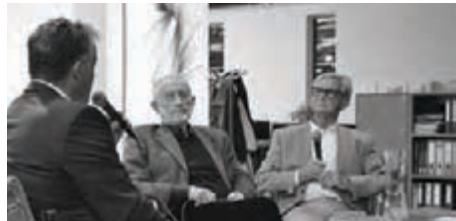
spielerisch zusammenzustellen, das hat den Jubilar sicher gefreut.