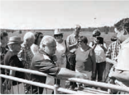
Auf dem Beobachtungsturm Spansberg

wurde der an Eichen reiche Wald in einen reinen Kiefernforst verwandelt. Das unwirtschaftliche Forstrevier erweckte aber auch militärische Interessen.