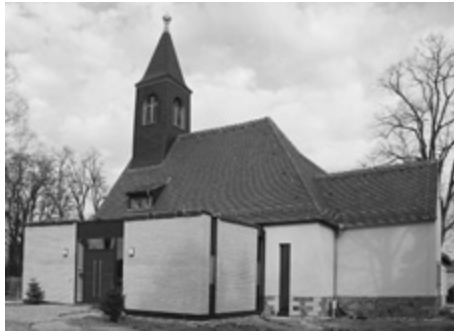
Kirche mit Anbau

Ein schöner heller Raum, er wirkt modern und offen und erinnert irgendwie an eine „Schwedekirche“. Die Rähnitzer Kirche liegt versteckt hinter Bäumen inmitten des Friedhofs an der Ludwig-Kossuth-Straße. Bisher kamen selten Besucher, um hier zu rasten oder einen Blick in das kleine Kirchlein zu werfen. Denn ein Schmuckstück war die Rähnitzer Kirche in den vergangenen Jahren nun wirklich nicht. Als wir im Jahr 2004 mit einer Festwoche das 100-jährige Jubiläum feierten, war die Kirche in einem bedauernswerten