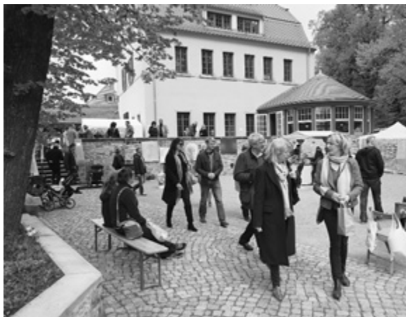
Reges Treiben am Bürgerzentrum