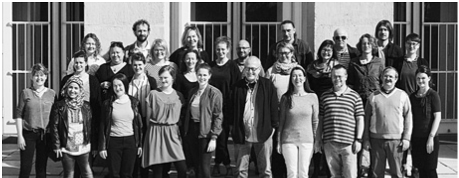
Das Hellerau-Team verabschiedet sich nach 10 Jahren

Das Festspielhaus ist wieder zu einem Ort der zeitgenössischen Künste gewor-