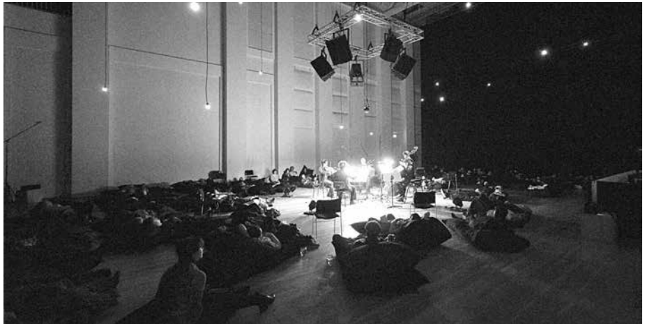
Musik im Liegen