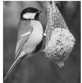
Kohlmeise am Knödel

Auf was sollte man nun bei der Winterfütterung achten? „Statt Massenfütterplätzen, die der Ausbreitung von Infektionen unter den Vögeln Vorschub leisten können, sind den einzelnen Arten angepasste Futtergeräte wesentlich besser und sinnvoller“, rät der Naturschützer Rüdiger Wohlers vom Naturschutzbund (NABU) im Oldenburger Land. „Dabei ist darauf zu achten, dass die Futtergäste nicht im Futter herumlaufen und es verschmutzen können“,