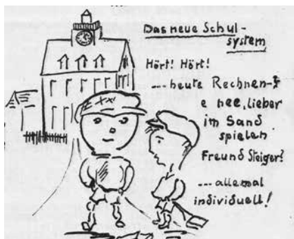
Karikatur in der Hellerauer Faschingszeitung 1926

nen? Nee, lieber im Sand spielen. Freund Steiger? ... allemal individuell!“ Eine derartige, präzise beobachtende Reflexion der Schulreform durch Hellerauer Zeitgenossen hätten manche unsererseits wohl nicht vermutet. Doch gerade in der